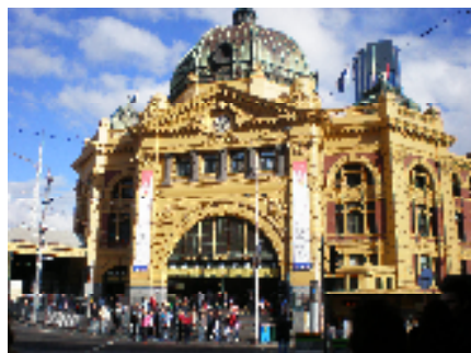
メルボルンシティ駅