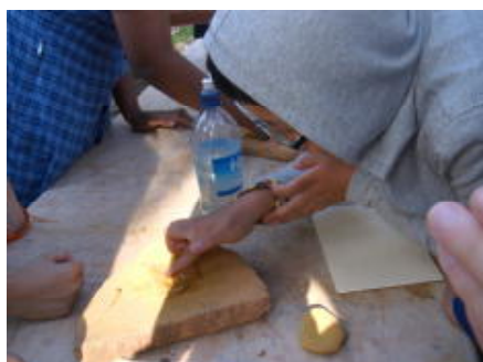
アボリジニ文化を体験中