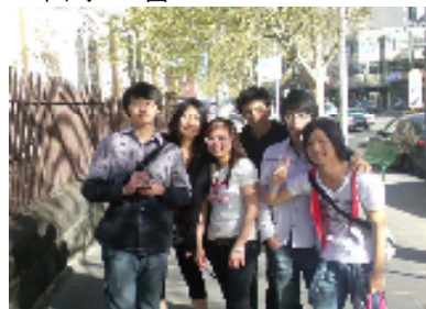
オーストラリアでできた友達!!