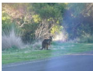
道路わきにカンガルー出現