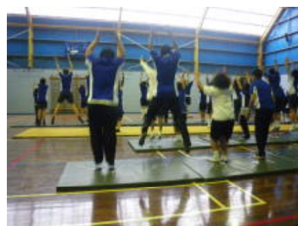
バディーと一緒に体育の授業