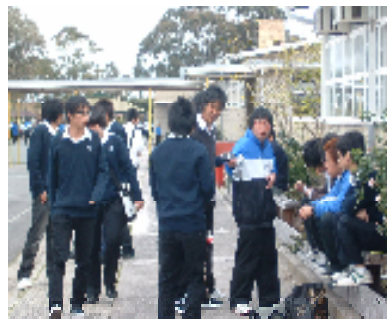
ウェストールの生徒たち